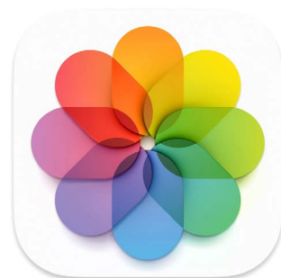
iCloud在您的iPad“照片” (Photos) 应用程序中备份照片和视频